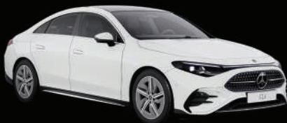
Blanc polaire uni

Différentes peintures sont à votre disposition lors de la configuration de votre CLA. L'offre s'étend des peintures standard classiques, telles que le blanc polaire, aux peintures métallisées haut de gamme, telles que l'argent high-tec, jusqu'aux peintures MANUFAKTUR exclusives, telles que le gris alpin standard MANUFAKTUR et le rouge Patagonie métallisé MANUFAKTUR. 2 teintes font également leur apparition dans la nouvelle CLA : le subtil menthe aqua standard met parfaitement en valeur le côté élégant du véhicule.