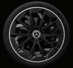
Jantes alliage AMG 48,3 cm 19" (RRI) à 5 branches noir brillant/naturel brillant