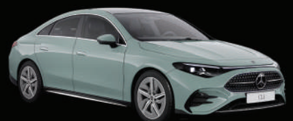
Aqua mint uni