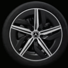
Jantes alliage AMG 45,7 cm 18" (RQQ) à 5 branches noir brillant/naturel brillant