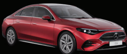
Rouge Patagonie métallisé MANUFAKTUR