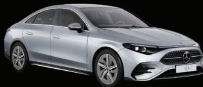
Argent high-tech métallisé