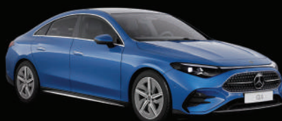
Bleu limpide métallisé