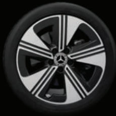
Jantes alliage 45,7 cm 18" (R67) à 5 branches

Selon l'équipement, vous avez également le choix entre différents designs de jantes 18 ou 19 pouces. Toutes les jantes sont optimisées sur le plan aérodynamique. Ainsi, elles ne sont pas seulement belles, mais elles améliorent aussi l'efficacité.