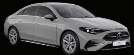
Gris alpin uni MANUFAKTUR