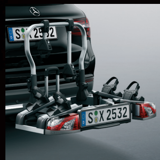
NOSAČI BIKIKLA (KROVNI; NA KUKU)

-15% POPUSTA U PERIODU OD 15.04-15.05.2026.