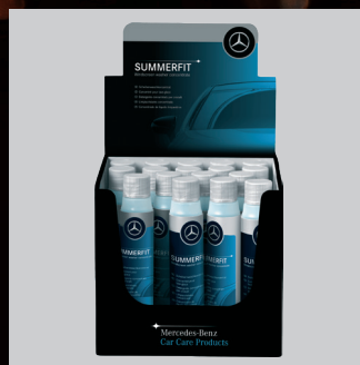
TEČNOST ZA STAKLA (KONCENTRAT 250 ML)