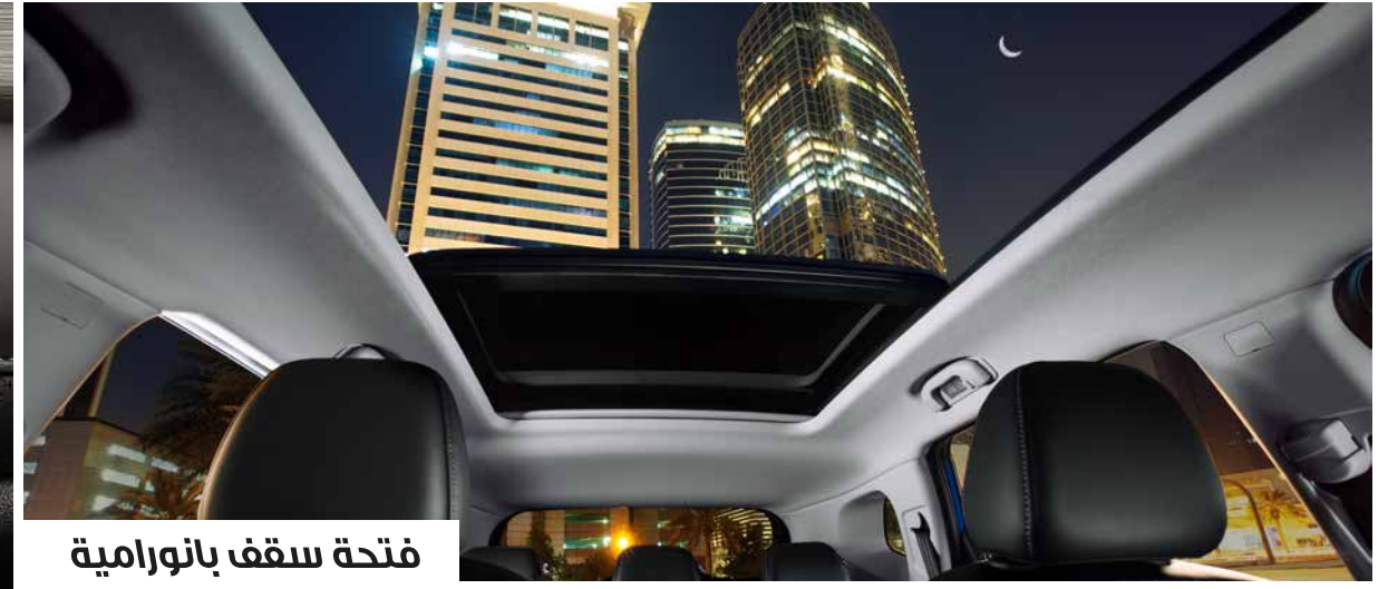
فتحة سقف بانورامية