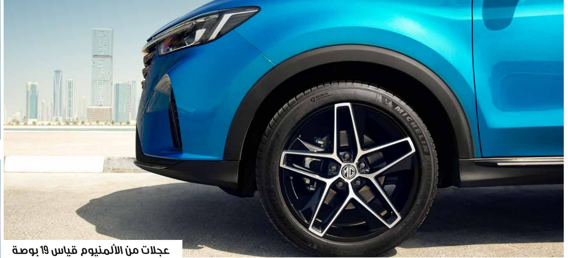
عجلات من الألمنيوم قياس 19 بوصة

انطلق بكل ثقة مع محرك 1.5 لتر بشاحن توربيني وأربع أسطوانات مجهز بناقل حركة أوتوماتيكي بـ 7 سرعات وكلاش مزدوج، لتشعر بقوة 171 حصاناً وعزم 275 نيوتن متر في متناولك.