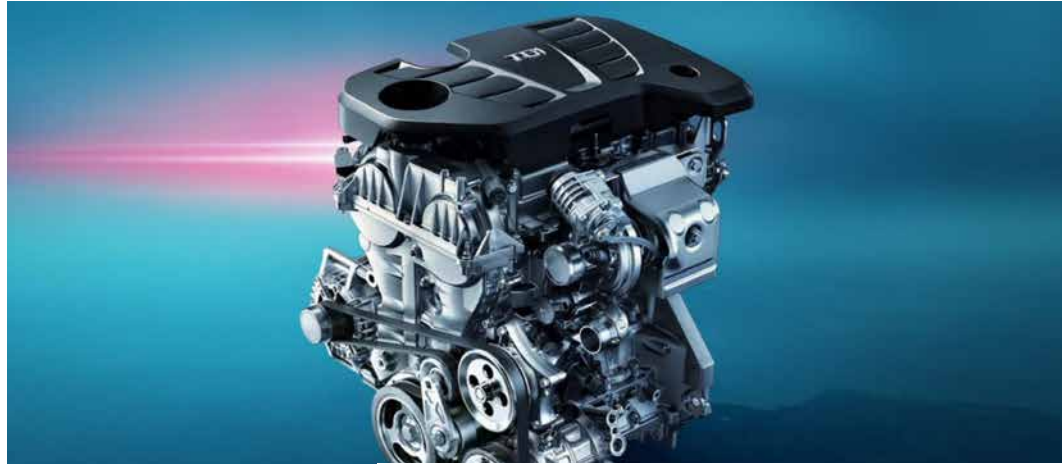
محرك 1.5 بشاحن توربيني وأربع أسطوانات