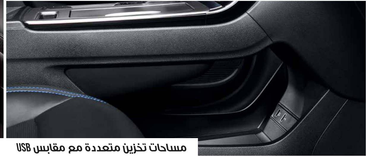
مساحات تخزين متعددة مع مقابس USB