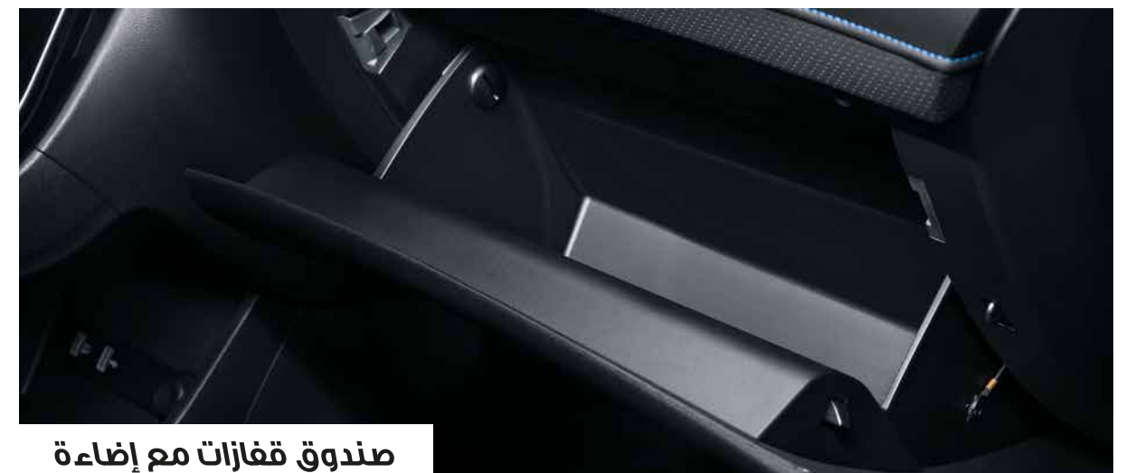
صندوق قفازات مع إضاءة