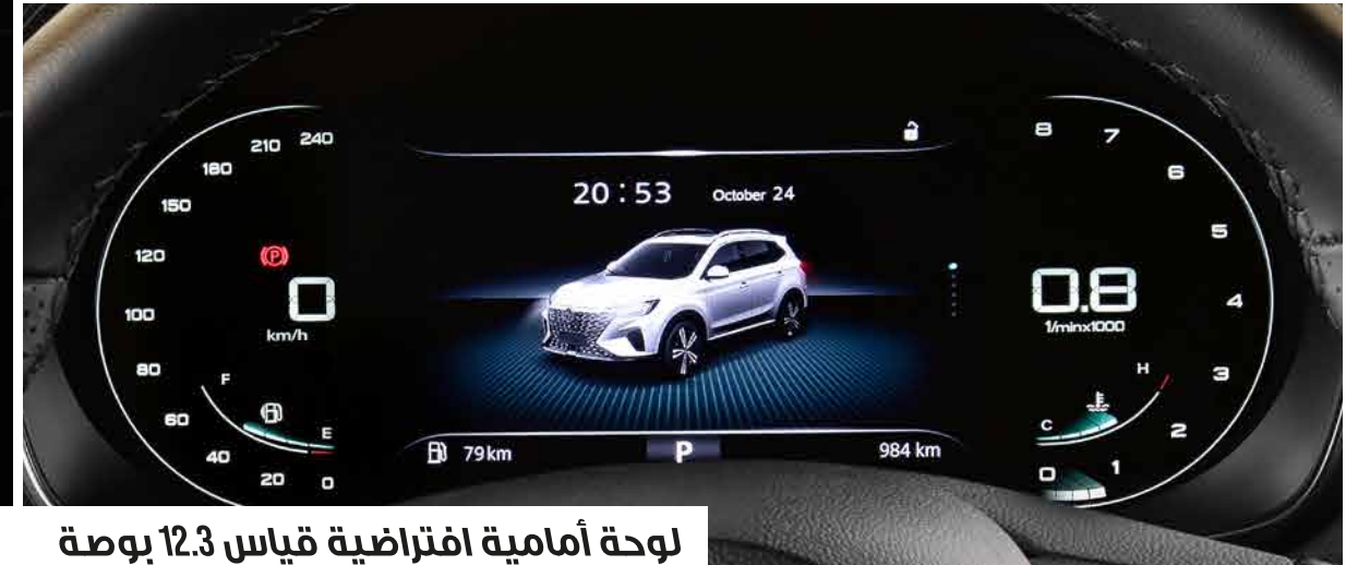
لوحة أمامية افتراضية قياس 12.3 بوصة