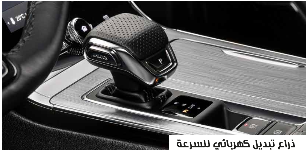
ذراع تبديل كهربائي للسرعة