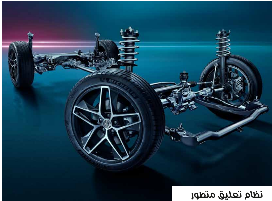
نظام تعليق متطور