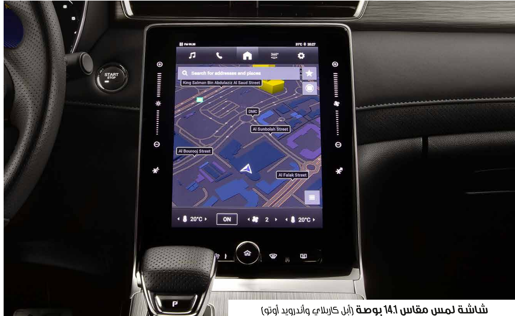
شاشة لمس مقاس 14.1 بوصة (أبل كاربلاي و أندرويد أوتو)