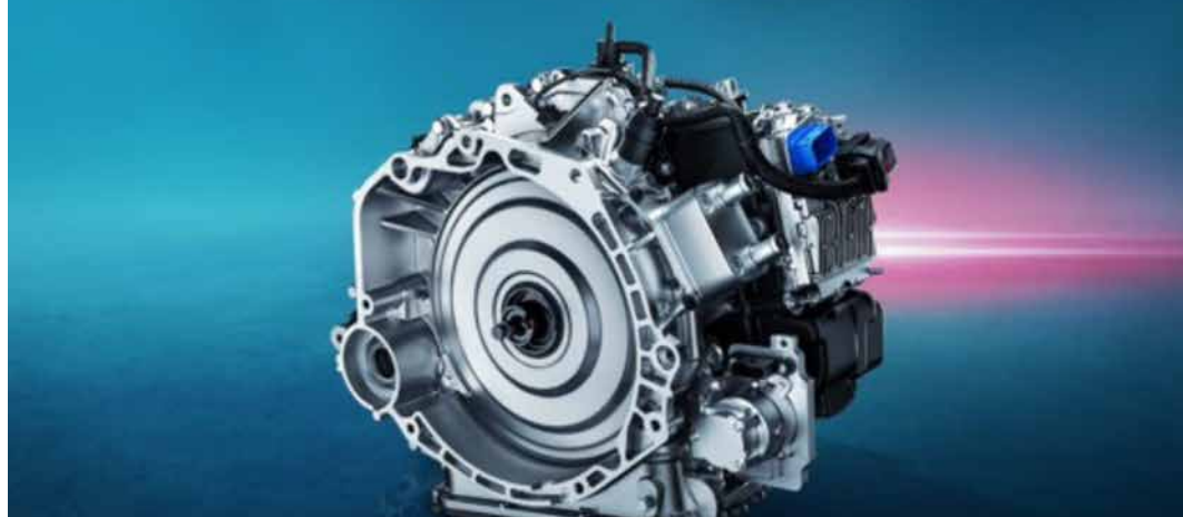
ناقل حركة بـ 7 سرعات وكلاش مزدوج