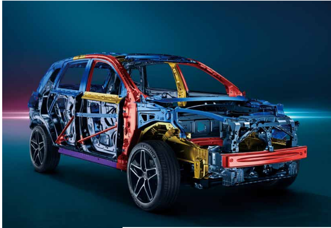
مقصورة من الفولاذ الصلب عالي الدرجة