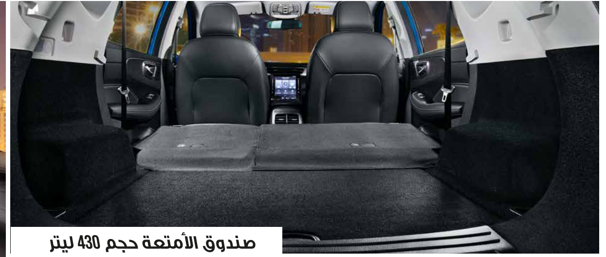
صندوق الأمتعة حجم 430 ليتر

استمتع بالقيادة السهلة في إم جي RX5 بفضل عدد من المزايا المريحة. خذ راحتك بتحميل وتخزين ما يخطر ببالك مع ميزة المقاعد القابلة للطي والمساحة الإضافية للتخزين في منطقة الركاب، ما يجعل أي رحلة أو جولة في المدينة تجربة أكثر سهولة وراحة.