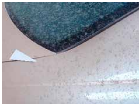
Niet acceptabel (chemie-inwerking; zichtbare aantasting)