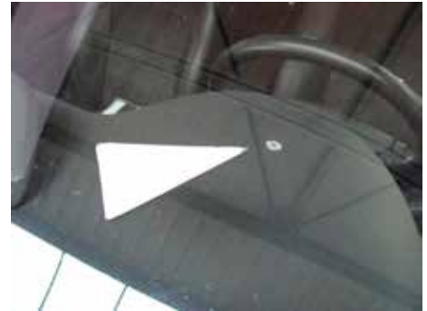
Niet acceptabel (tussenlaag warmtewerende ruit aangetast)