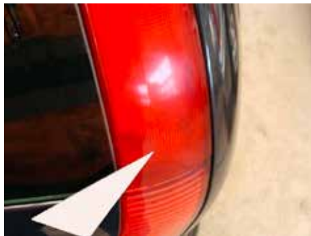
Niet acceptabel (barst in de lichtunit)