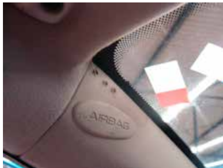
Niet acceptabel (microfoon gedemonteerd A-stijl)