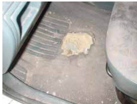
Niet acceptabel (gat in vloerbekleding)