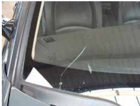
Niet acceptabel (sterretje uitgelopen in een barst)