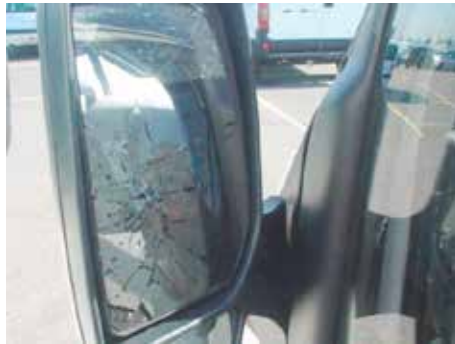
Niet acceptabel (spiegelglas gebarsten)