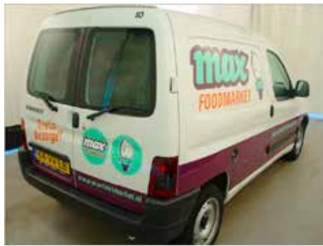
Niet acceptabel (bestickerd voertuig met reclame)