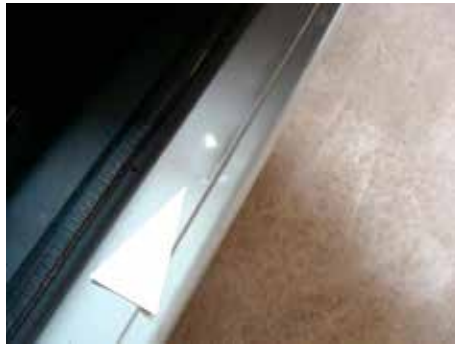
Niet acceptabel (dorpel gedeukt)