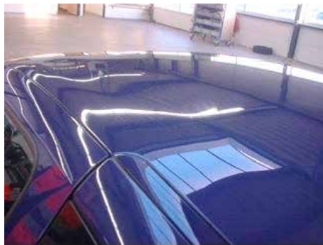
Niet acceptabel (molest; voetstappen op dak)