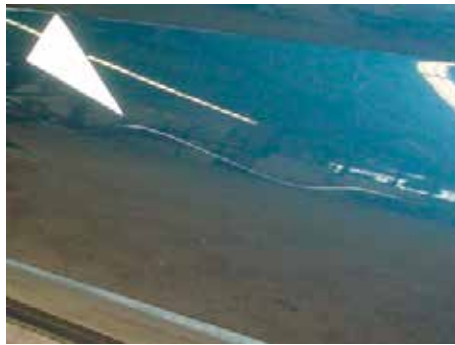
Niet acceptabel (kras door de lak heen)