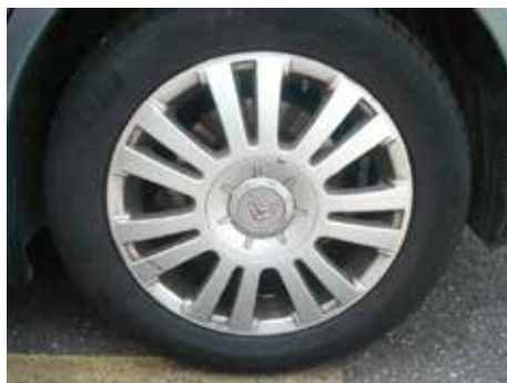
Acceptabel (velg beschadiging buitenste rand tot max. 10 cm)