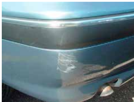
Niet acceptabel (beschadiging tot op de grondlak)