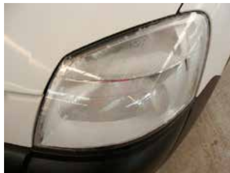
Acceptabel (condens in lichtunit; reflector niet aangetast)