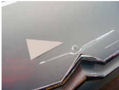
Niet acceptabel (deukje niet te modelleren)