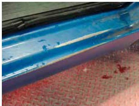
Niet acceptabel (roestvorming op en rond de beschadiging)