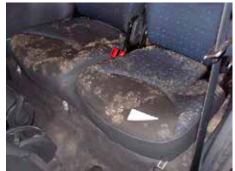
Niet acceptabel (schimmelvorming)