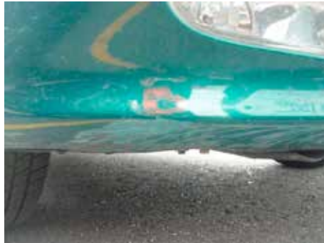
Acceptabel (onderzijde voorspoiler)