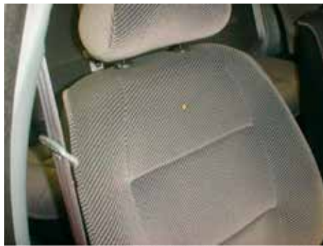
Niet acceptabel (brandgat in stoelbekleding)