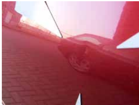
Acceptabel (maximaal 2 centimeter; niet gevouwen)