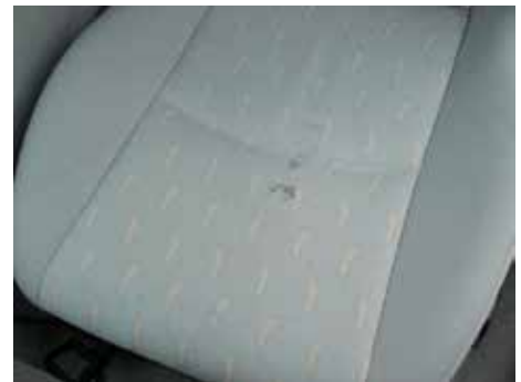
Niet acceptabel (vetvlekken)