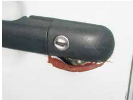
Niet acceptabel (niet gerepareerde inbraakschade)