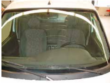
Niet acceptabel (krassen door ruitenwissers)