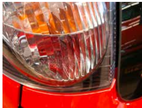
Acceptabel (haarscheurtjes van binnenuit)