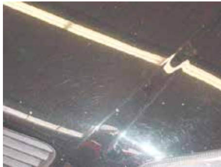
Acceptabel (>75.000 kilometer)