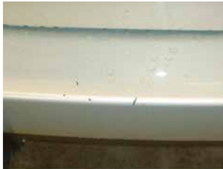
Acceptabel (maximaal 5 krasjes door de lak heen)