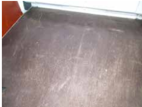
Acceptabel (lichte krasschade)