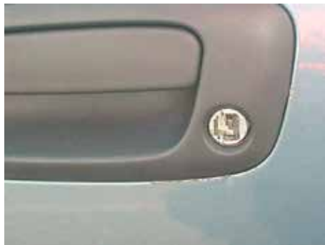
]Niet acceptabel (niet gerepareerde inbraakschade)