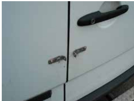
Niet acceptabel (sloten op het plaatwerk aangebracht)