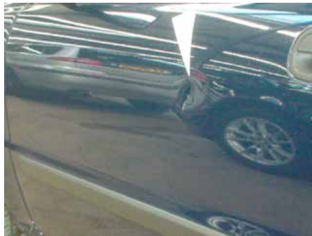
Niet acceptabel (deukje gevouwen)