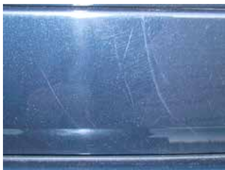
Acceptabel (oppervlakkige poetskrassen)