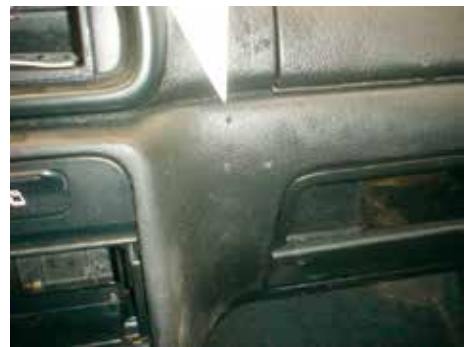
Niet acceptabel (gaten door gedemonteerde carkit)