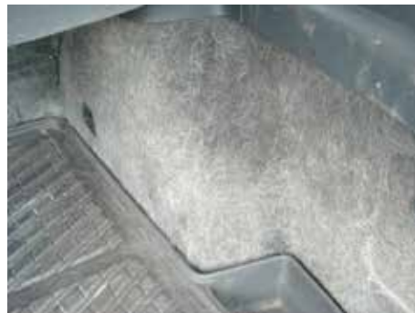
Niet acceptabel (ernstige vervuiling door hondenharen)

Als gevolg van gebruik kunnen delen lichte slijtage vertonen, denk hierbij bijvoorbeeld aan het stuurwiel. Het stuurwiel mag slijtage vertonen echter mogen er geen 'scheuren' of happen uit het kunststof/leder zijn. Vloerbekleding mag lichte slijtage vertonen, scheuren en gaten in vloerbekleding zijn niet acceptabel.