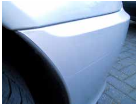
Acceptabel (lichte lakbeschadiging)