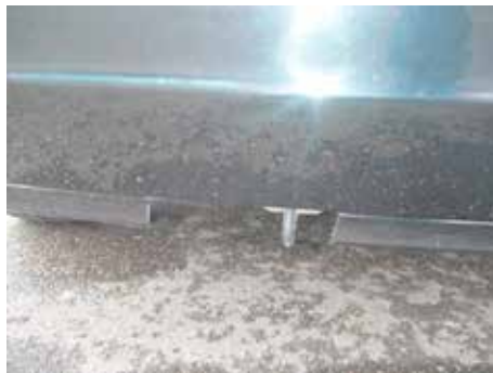
Niet acceptabel (uitsparing gedemonteerde trekhaak)