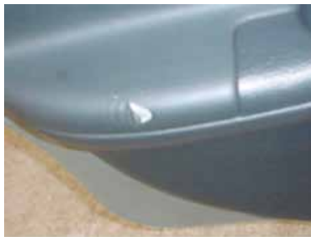
Niet acceptabel (scheur in bekleding deurpaneel)