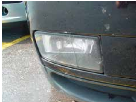
Niet acceptabel (scheur/barst in de lichtunit)