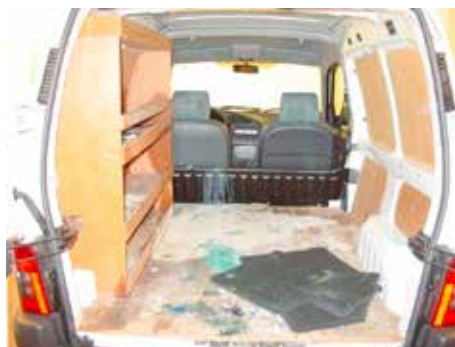
Acceptabel (verfvlekken op laadvloer)