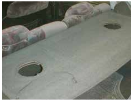
Niet acceptabel (speakers gedemonteerd)