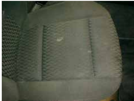
Acceptabel (vlekken verwijderbaar)