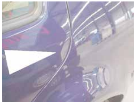
Niet acceptabel (portierrand gevouwen)