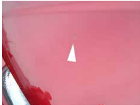
Acceptabel (vogelvuil; te poetsen/geen aantasting lak)