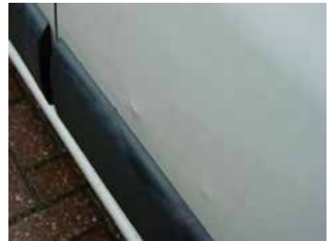
Niet acceptabel (deuken van binnen naar buiten)