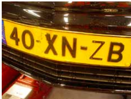
Niet acceptabel (luxe plaat; letters manco en gebroken)