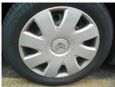
Acceptabel (lichte oppervlakkige schaafplek, max. 10 cm)