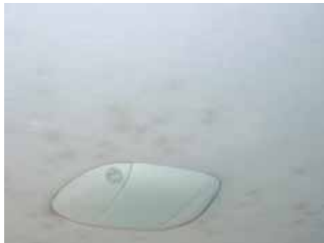
Niet acceptabel (meer dan 5 vervuilde plekjes)