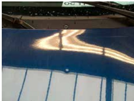
Acceptabel (één deukje te modelleren)