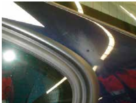
Niet acceptabel (op één plek dof gepoetst)