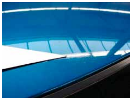
Niet acceptabel (vogelvuil; zichtbare aantasting)