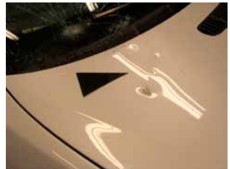
Niet acceptabel (molest; voorwerp op motorkap gegooid)