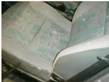
Niet acceptabel (verfvlekken)