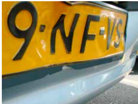
Niet acceptabel (kentekenplaat gedeukt)

Kentekenplaten mogen niet beschadigd of gebogen zijn. Bij luxe kentekenplaten mogen geen kunststofdelen van de letters en/of cijfers afgebroken zijn of missen.