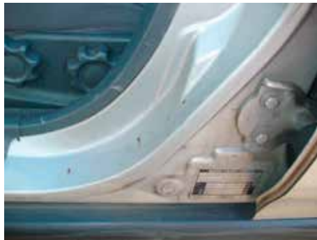
Niet acceptabel (sponning gedeukt/roestvorming)