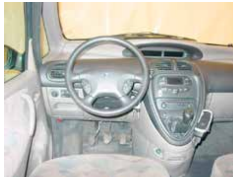
Acceptabel (carkit blijft gemonteerd, gaten niet zichtbaar)