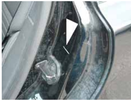
Acceptabel (krasje door de lak heen, geen roest/deukje)