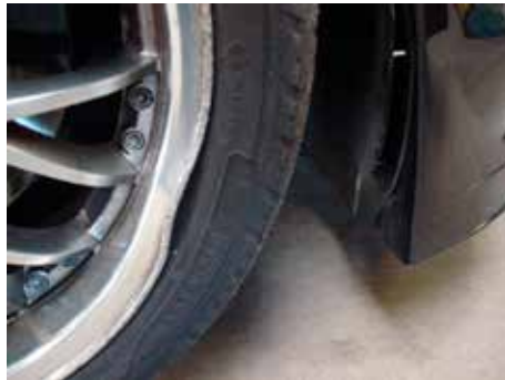
Niet acceptabel (velg gedeukt)