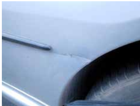
Niet acceptabel (gleedeuk)