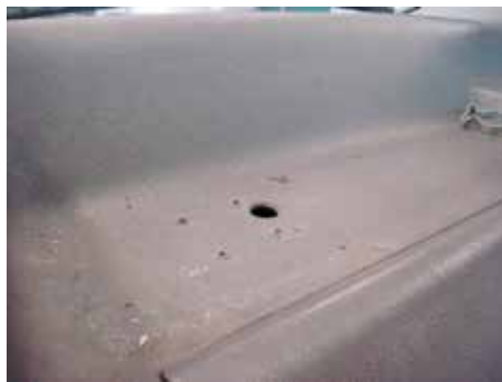
Niet acceptabel (doorvoergaten voor kabels)