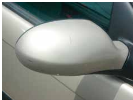
Niet acceptabel (krassen door de lak heen)