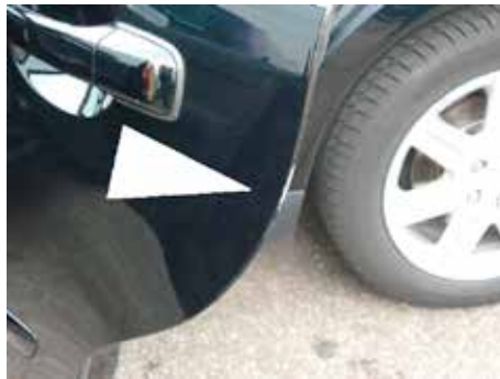
Acceptabel (lichte lakbeschadiging tot 10 cm.)