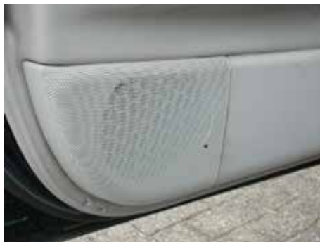
Niet acceptabel (scheuren in speakerkap)