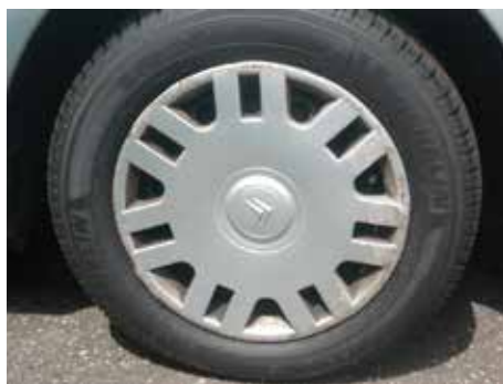
Niet acceptabel (beschadiging tot in het kunststof)