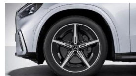
Код: RRN | AMG 20"