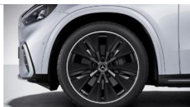
Код: RWE | AMG 21"

Всички цени са препоръчителни. Тази ценава листа важи от 01.04.2026 г. до промяната ѝ.