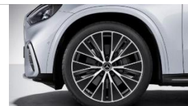
Код: RWD | AMG 21"