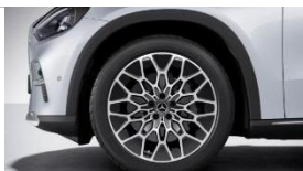
Код: 17R | 20"