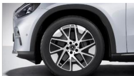
Код: 11R | 19"