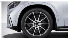
Код: RVQ | AMG 20"