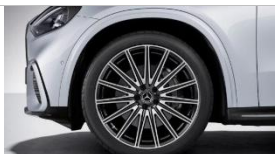
Код: RWI | AMG 21"