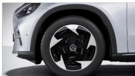
Код: R19 | 19"