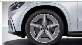
Код: RRM | AMG 20"