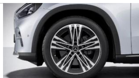
Код: 53R | 20"